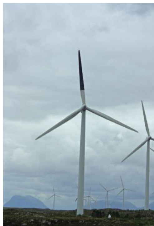
Kuvio 1. Vasen: Ärsykelapakuviot. Saatu Mclsaacilta (2000). Oikealla: Tuulivoimala maalatulla roottorin lavalla 71 .

Uudehkossa tutkimuksessa, May ym. (2020) ovat testanneet kontrastimaalauksen tehokkuutta maalaamalla yhden roottorin lavoista mustaksi ( Kuvio 1 ) lintujen törmäysten vähentämiseksi 71 . Tämän tutkimuksen tulokset viittaavat siihen, että vuotuinen kuolleisuus väheni maalatulla lavalla varustetuissa voimaloissa yli 70 %, mikä vähensi useiden lintujen törmäysriskiä. Tulokset osoittivat kuitenkin, että vuotuiset kuolleisuusluvut vaihtelivat huomattavasti vuosien välillä ja sisällä, joten kirjoittajat korostavat pitkäaikaisten tutkimusten tarvetta vankkojen ja vakuuttavien tulosten saamiseksi. Samoin ultraviolettiheijastavaa maalia on ehdotettu lapojen näkyvyyden lisäämiseksi, mutta niiden tehokkuutta ei ole testattu tuulivoimaloissa, ja näyttää siltä, että se ei ole menetelmä, joka toimii haavoittuvimmille lajeille, kuten korppikotkille 31 .