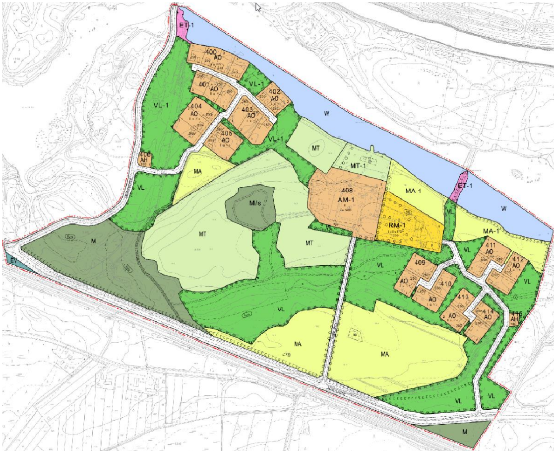
Roinilan asemakaava suunnittelualueella.