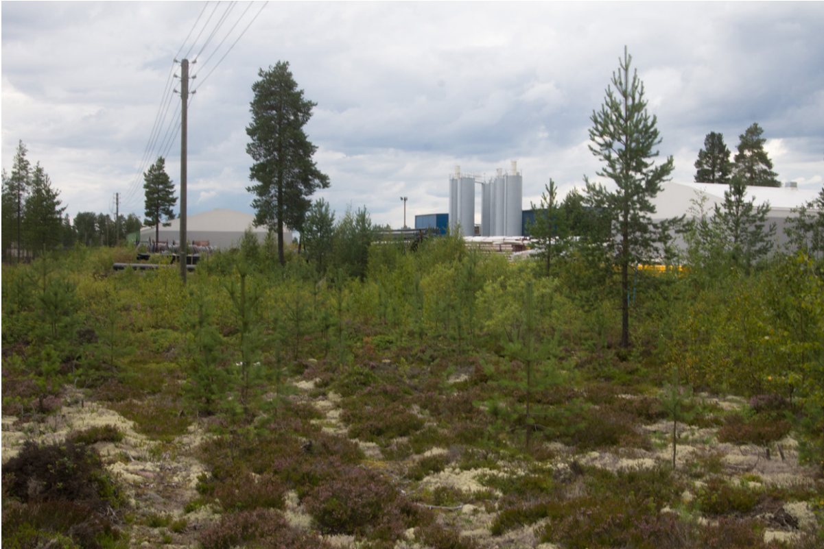
Kuva 2. Taimettuva karukkokangas

Välisuon pohjoispuolella ei ole luonnontilaisia alueita. Keskiosissa on kulutuksessa jonkin verran muuntunutta ja hakattua karukkokangasta, jonka uhanalaisuusluokka luonnontilaisena on äärimmäisen uhanalainen (CR, Etelä-Suomi). Hiekkaisella karukkokankaalla kasvaa hietikkohanhempajua ( Salix repens subsp. arenaria ). Karukkokankaan muutoksesta kertovat lukuisat koivun ( Betula pendula ) taimet, jopa taimettunut harmaaleppä ( Alnus incana ).