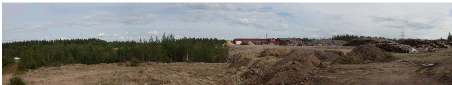
Kuva 1. Alueen länsireunan varastoalue, ruderaattimaita. Vesikuopat kuvan vasemman reunan takana.