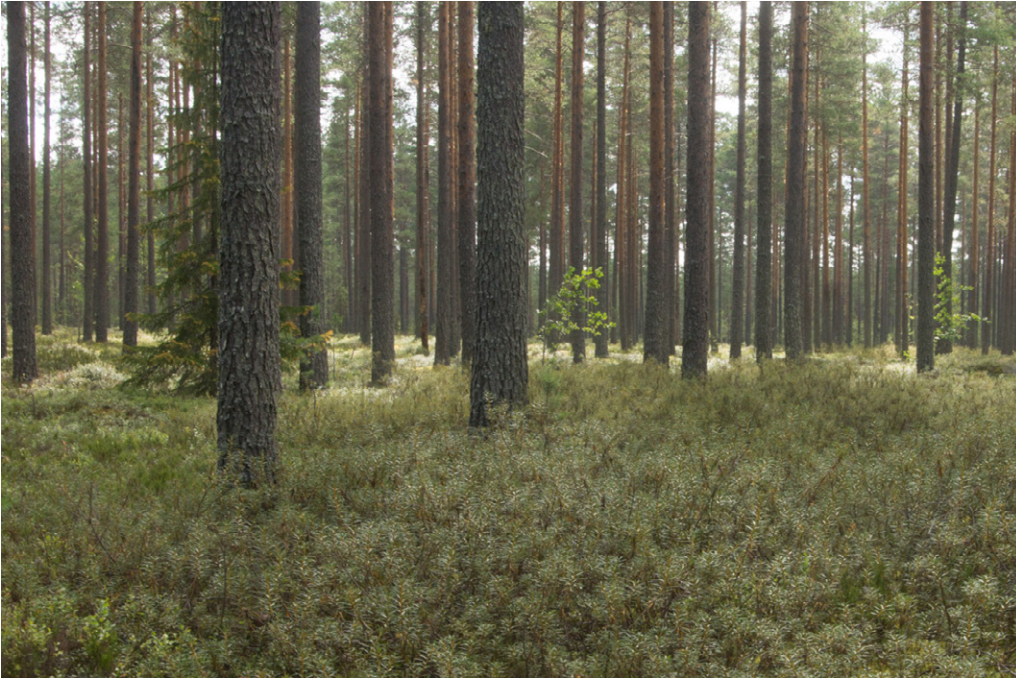
Kuva 6. Välisuon eteläpuolista kangasmetsää, Etualalla kangasmetsän soistuma (suopursua), taka-alalla vastavalossa kilottaa puolukka, ja tyypiltään metsä on kuivahkoa kangasta. Vasemmassa alanurkassa erottuu muutama mustikan vaalean vihreä varpu. Matalammilta osilta kangas on mustikkavaltaista tuoretta kangasmetsää.