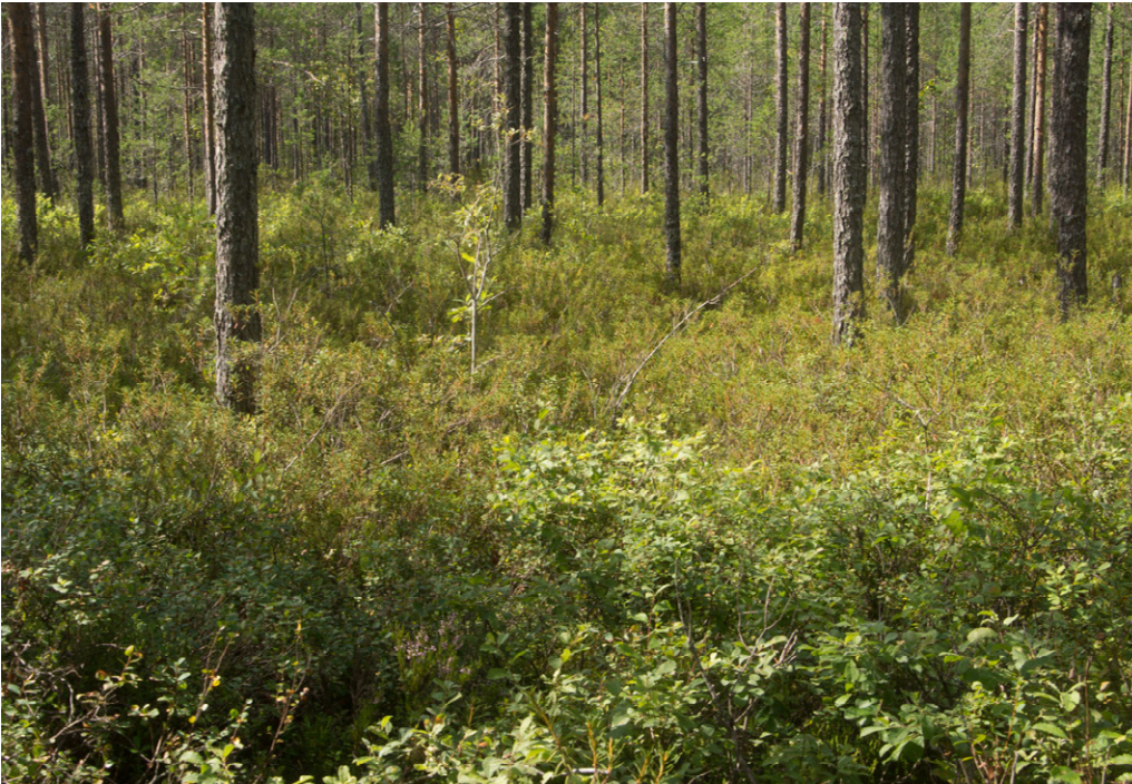
Kuva 7. Välisuon eteläpuolisen kangasmetsän sisään jää laikku isovarpurämettä. Kuvassa suopursua, vaivaiskoivua ( Betula nana ), juolukkaa ja etualalla suon ja kivennäismaan reunassa usein viihtyvää virpapajua ( Salix aurita ). Isovarpurämeiden uhanalaisluokitus v. 2018 on vaarantunut (NT).