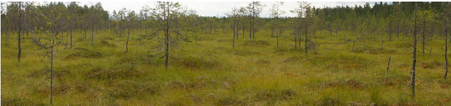
Kuva 5. Välisuon oligotrofinen lyhytkorsisäme on luontotyyppien uhanalaistarkastelussa luokiteltu vaarantuneeksi (VU) keskiborealisella eli ns. Etelä-Suomen alueella. Välisuota on osin ojitettu, mutta se on yhä luonnontilaisen kaltainen. Kuva suon länsipäästä. – Vrt. kansikuva Keisarintieltä, itäpäästä.

Välisuon eteläpuoleinen kangasmetsä on pilarimäntyistä talousmetsää. Tyypiltään se on tuoretta kangasta, jossa valtavarpuuna on mustikka, tai korkeammilta kohdiltaan puolukkavaltaista kuivahkoa kangasmetsää. Reunat ovat Välisuon suuntaan isovarpurämettä, mutta kangasmetsissä on painumissa suopursu- ja juolukkavaltaisia soistumia. Karttaan merkitty laajempi soistuma on sekin isovarpurämettä.