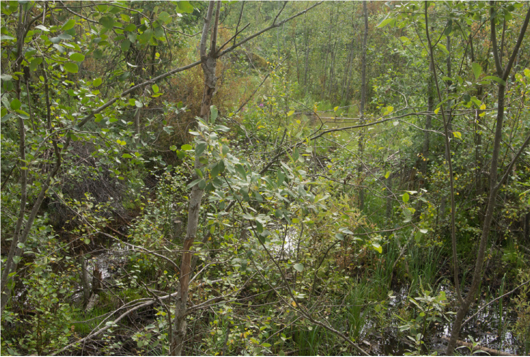
Kuva 3. Luhtainen vesikuoppa

Luoteisnurkan tuore kangas on Mustikkakankaan nimen veroinen: mäntykangasta, jossa valtavarpu on mustikka. Viereiset vesikuopat ja metsäkortekorpi kertovat myös alueesta, jossa pohjavesi on korkealla. Maa-perä on soramoreenia, joka sisältänee myös vettä pidättävää ainesta.