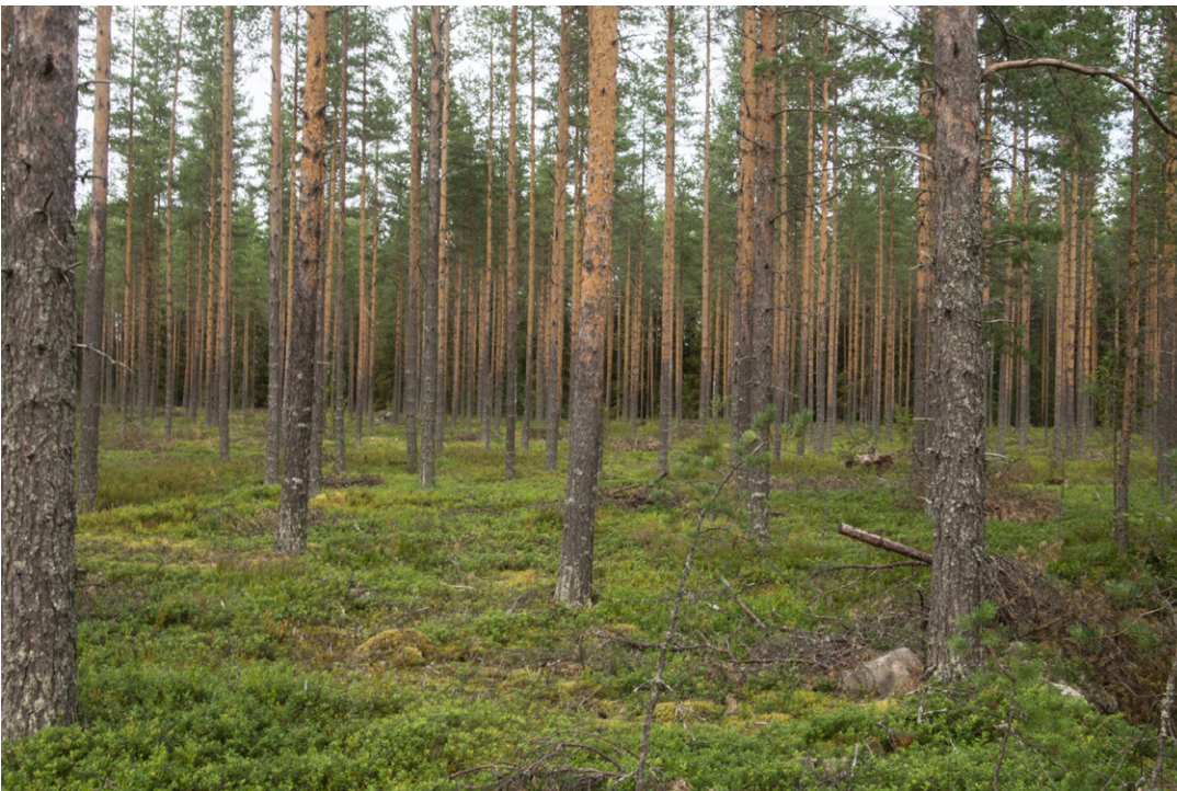
Kuva 4. Mustikkakankaan valtavarpu on mustikka.

Luoteisnurkan tuore kangas on Mustikkakankaan nimen veroinen: mäntykangasta, jossa valtavarpu on mustikka. Viereiset vesikuopat ja metsäkortekorpi kertovat myös alueesta, jossa pohjavesi on korkealla. Maa-perä on soramoreenia, joka sisältänee myös vettä pidättävää ainesta.